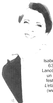
Isabella Rossellini, 63 anni, volto di Lancôme. A fianco, un momento del festival mondiale L'età della felicità, ( www.alternativeageing.net ).

Dalle auto ai cosmetici, dagli elettrodomestici intelligenti ai viaggi. I prodotti dedicati agli over 65 sono l'ultima tendenza. Perché oggi i senior non solo aumentano: molti di loro hanno anche soldi e tempo libero. E potrebbero essere tra i protagonisti della ripresa economica