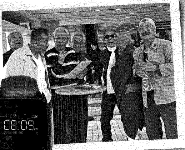
Accanto, lo smartwatch Haier con la funzione Sos anziani. Sopra, il cast over 70 di Ryuzo and the seven henchmen di Takeshi Kitano, presentato al Festival del Cinema Africano, d'Asia e America Latina, a Milano dal 4 aprile.