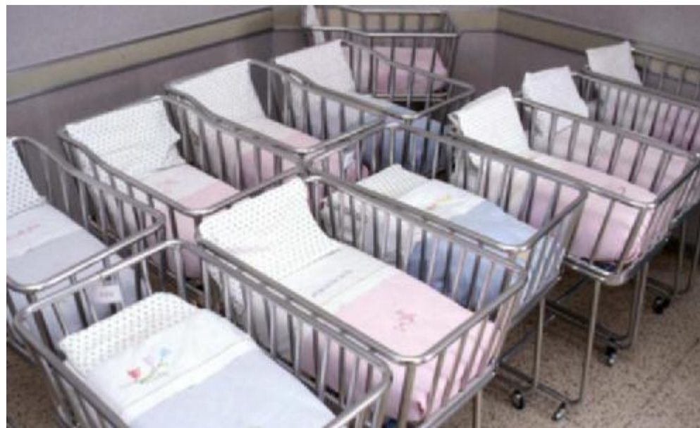
Culle sempre più vuote negli ospedali italiani. I giovani tardano a mettere su una famiglia propria

Il nostro Paese, uscito devastato dalla Seconda guerra mondiale, con un'economia molto arretrata, prevalentemente agricola è riuscito in dieci-quindici anni a recuperare e raggiungere il livello degli altri paesi europei, combinando il baby boom e il boom economico. Cosa insegna questo? Che l'Italia ha una grande potenzialità. Bisogna indirizzarla nel modo giusto, con progettualità: serve una politica lungimirante che guarda ai giovani, che investe per loro in politiche attive, per non farli fuggire via e per non costringerli a ricorrere alla famiglia come ammortizzatore sociale. ●