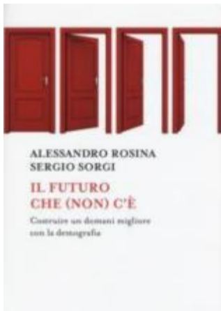
La copertina del saggio

ghi per affermarsi e scarsissimi investimenti in questi settori dove maggiore potrebbe essere il contributo dei giovani, ovvero ricerca e sviluppo. Il nostro è un Paese sulla difensiva, che fa scelte in difesa di chi ha accumulato benessere nel passato, anziché investire su chi può produrre uno nuovo, che è orientato di più sulle esigenze degli anziani, che hanno un peso elettorale maggiore, piuttosto che sui giovani, che sono pochi e in difficoltà.